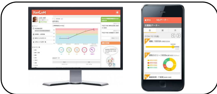
※画面は開発中のものです